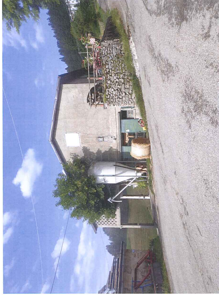
IMMOBILE 2 m.n. 640