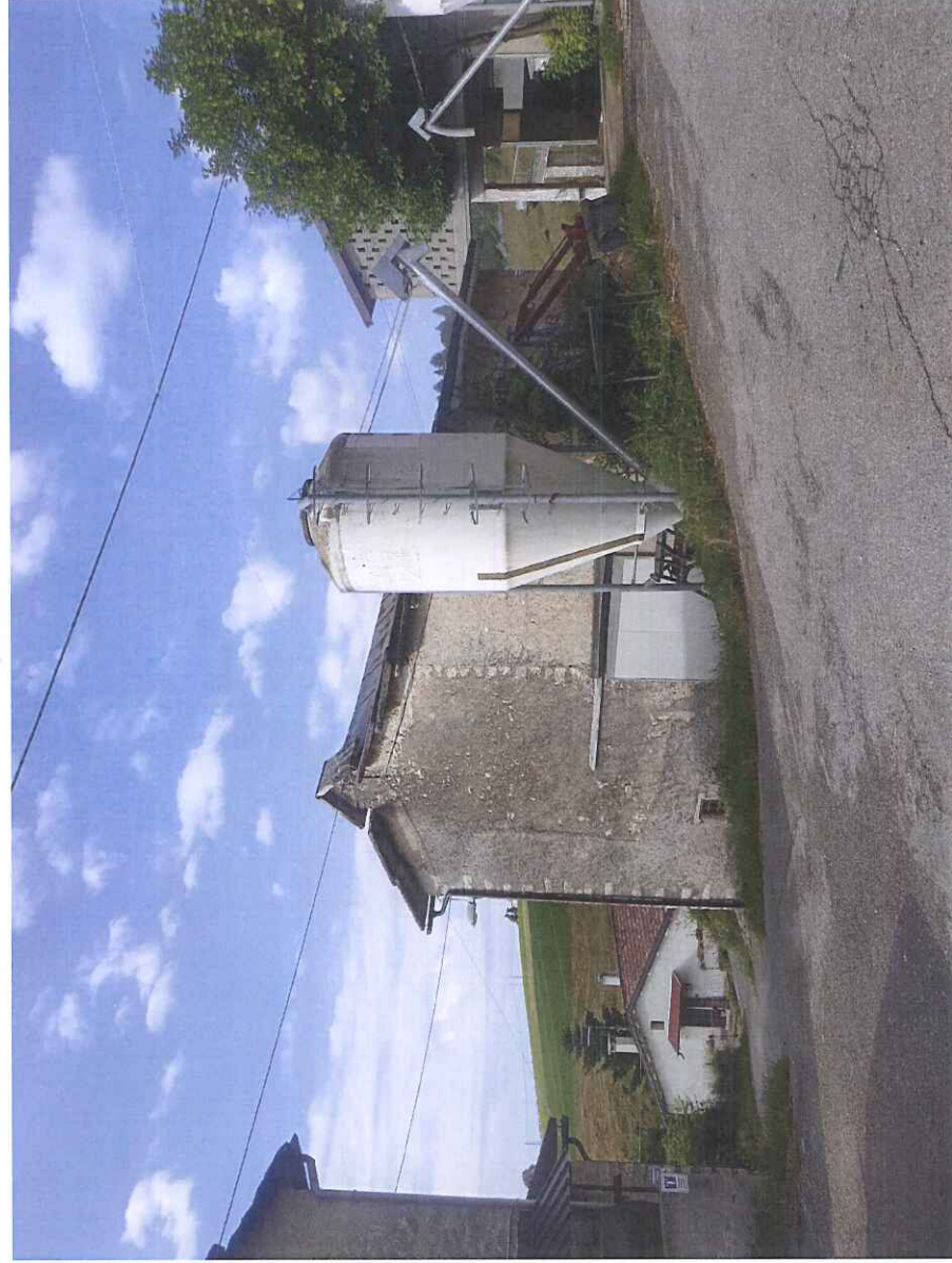
IMMOBILE 1 m.n. 641